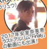
2017年安室奈美恵 ラストアルバム「Finiky」 の動画にも出演!